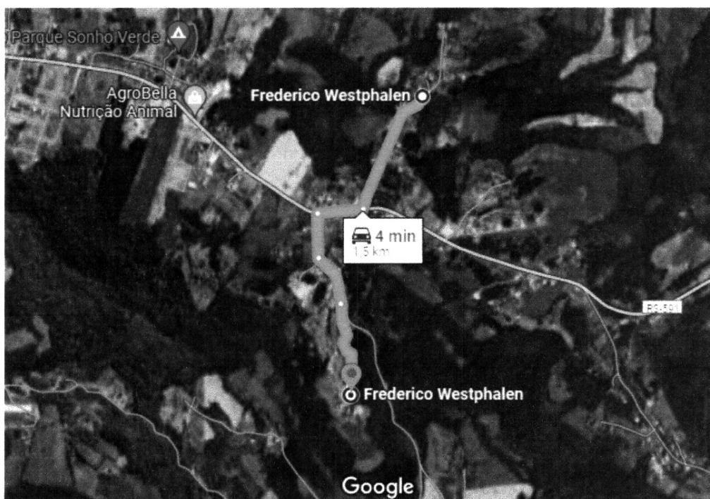
Situação/Localização – Jazida de Pedra Irregular

Proponente: Município de Frederico Westphalen/RS