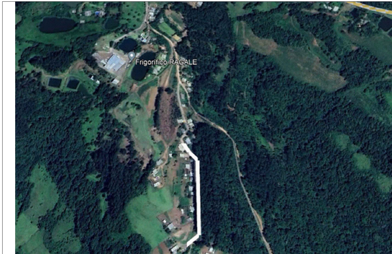
PLANTA DE LOCALIZAÇÃO S/ ESCALA