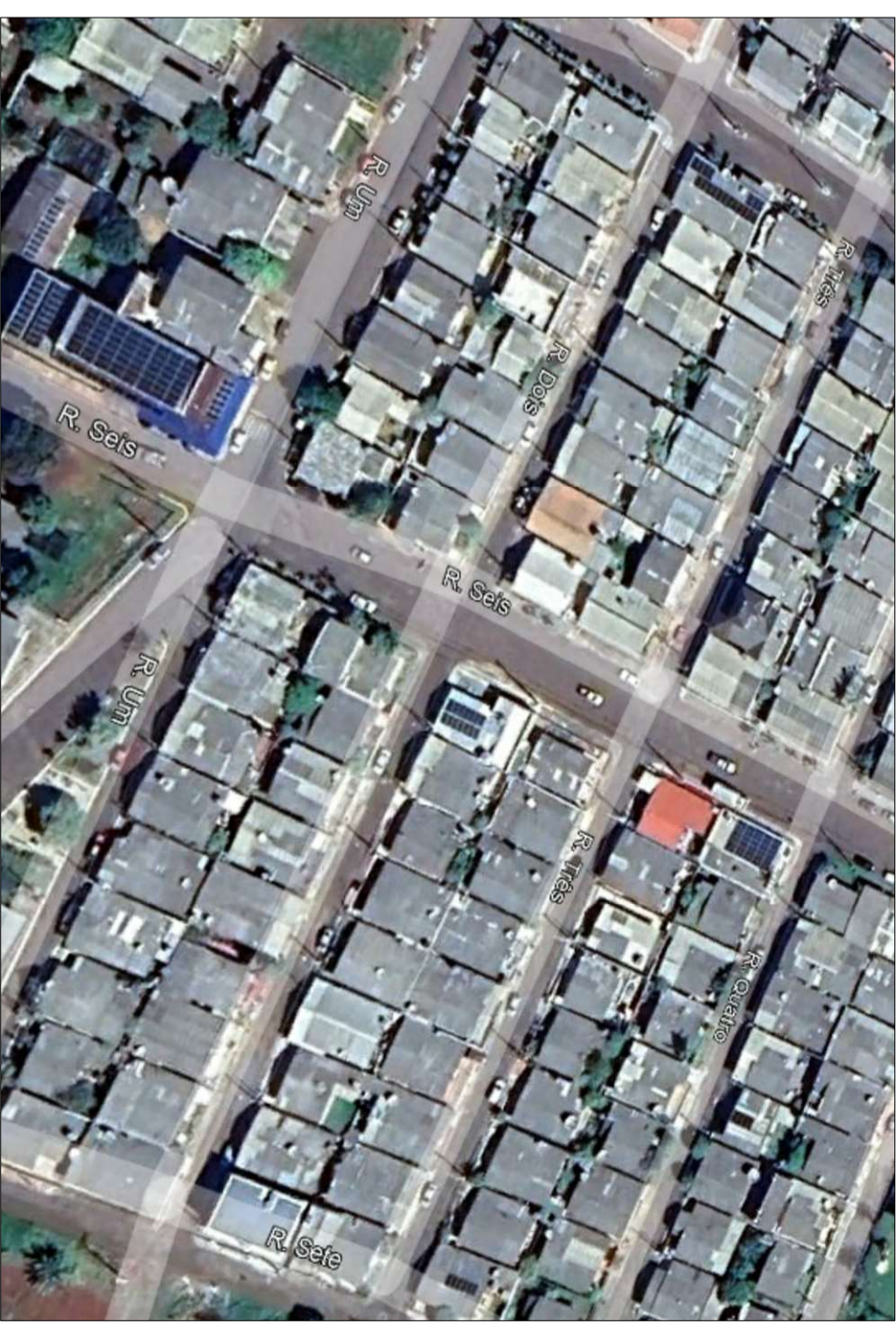
PLANTA DE LOCALIZAÇÃO S/ ESCALA