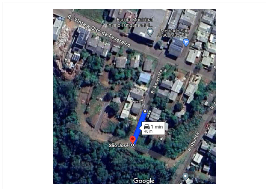
PLANTA DE LOCALIZAÇÃO S/ ESCALA