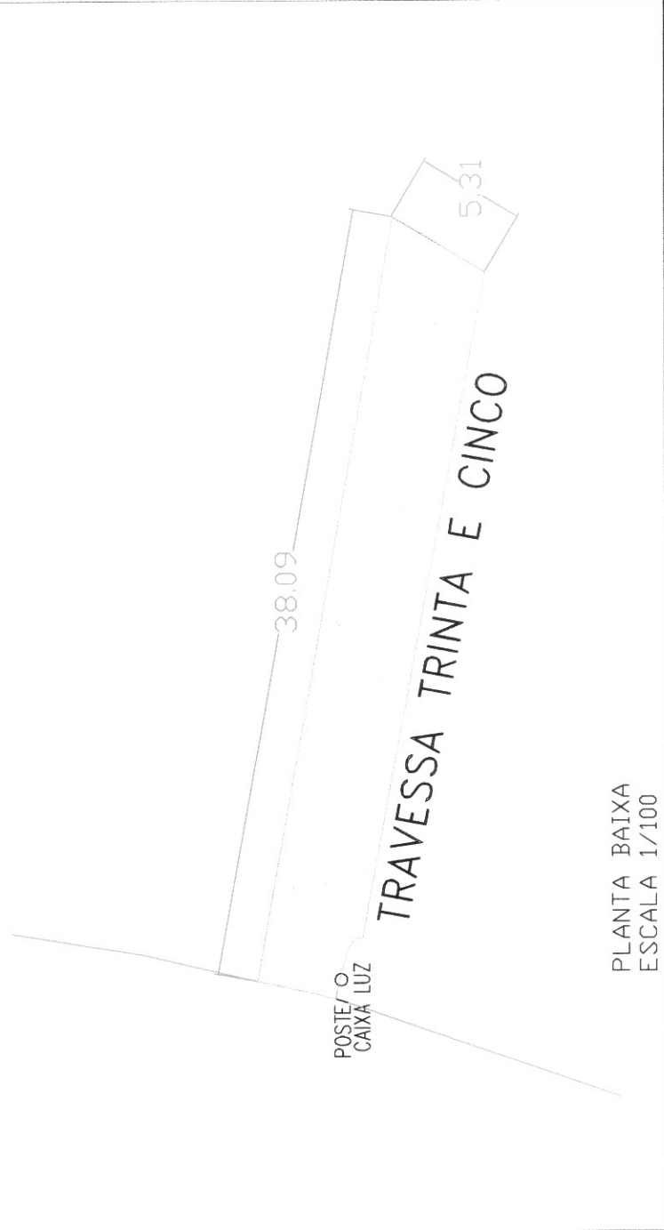
PLANTA BAIXA ESCALA 1/100