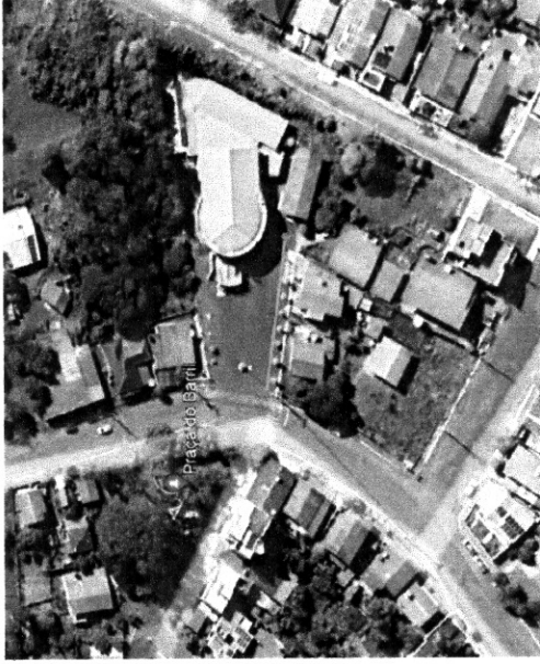
PLANTA DE LOCALIZAÇÃO S/ ESCALA