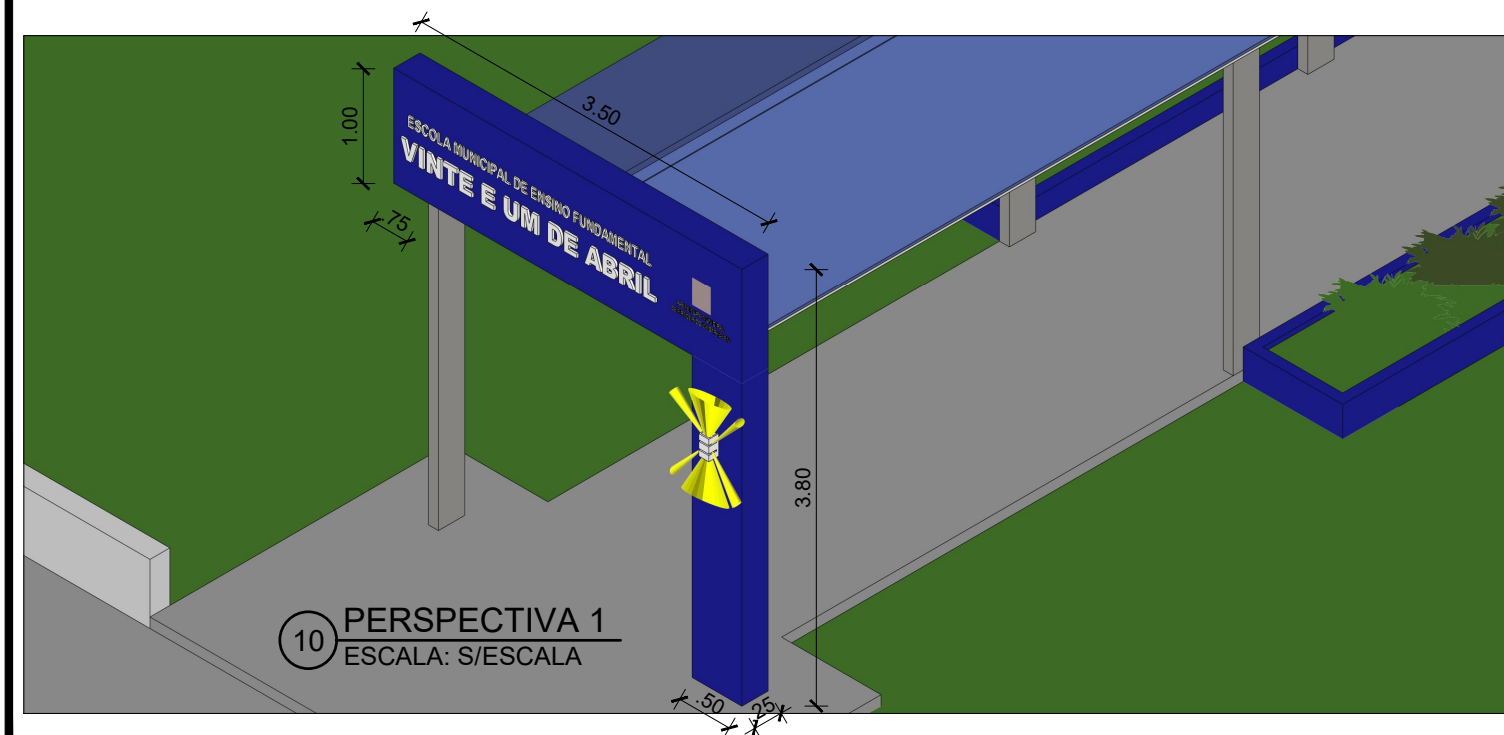
10 PERSPECTIVA 1 ESCALA: S/ESCALA