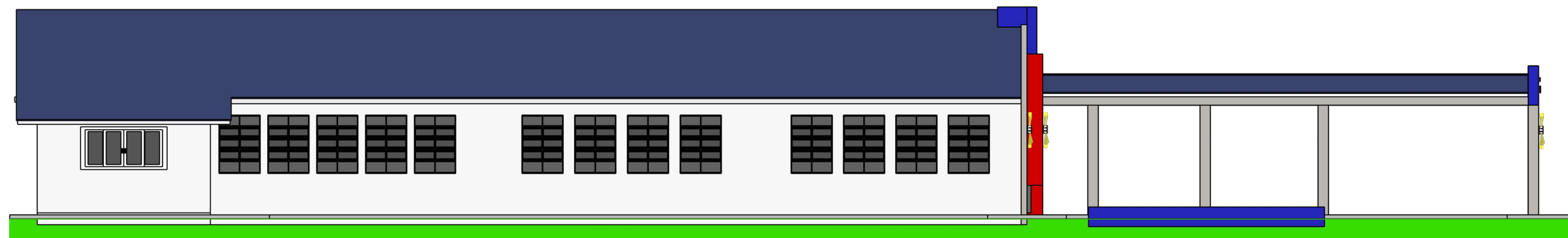
08 FACHADA LATERAL ESQUERDA ESCALA 1/75