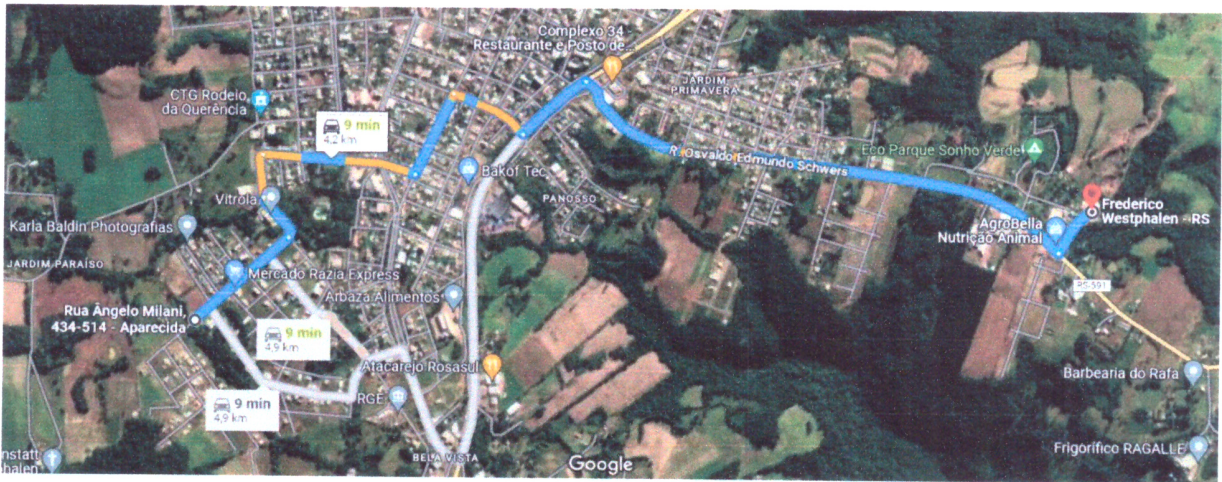
Situação/Localização – Jazida de Pedra Irregular

Proponente: Município de Frederico Westphalen/RS