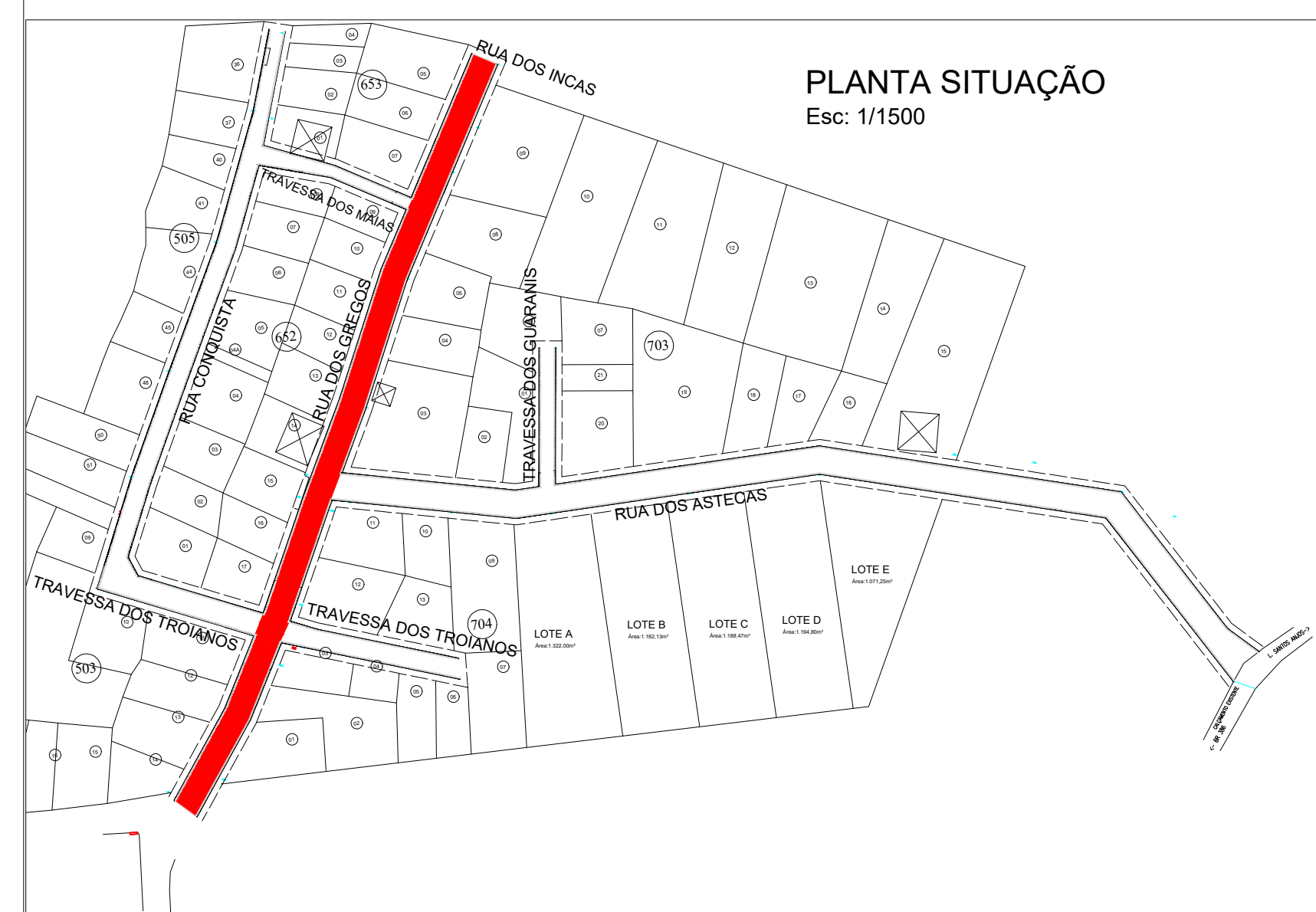
PLANTA SITUAÇÃO Esc: 1/1500

OBS: AS COTAS SÃO REFERÊNCIAS PARA O PERFIL JÁ PAVIMENTADO