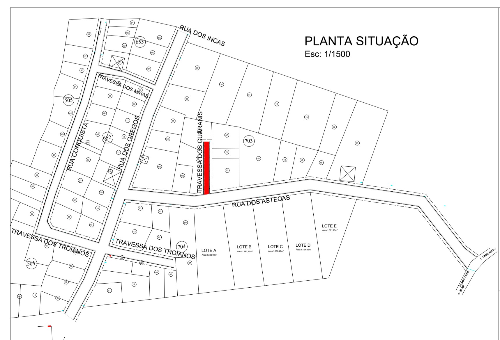
PLANTA SITUAÇÃO Esc: 1/1500