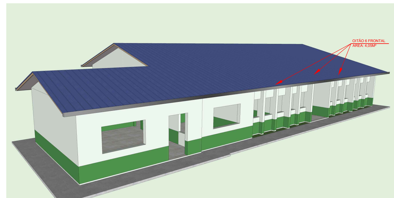
08 PERSPECTIVA 4