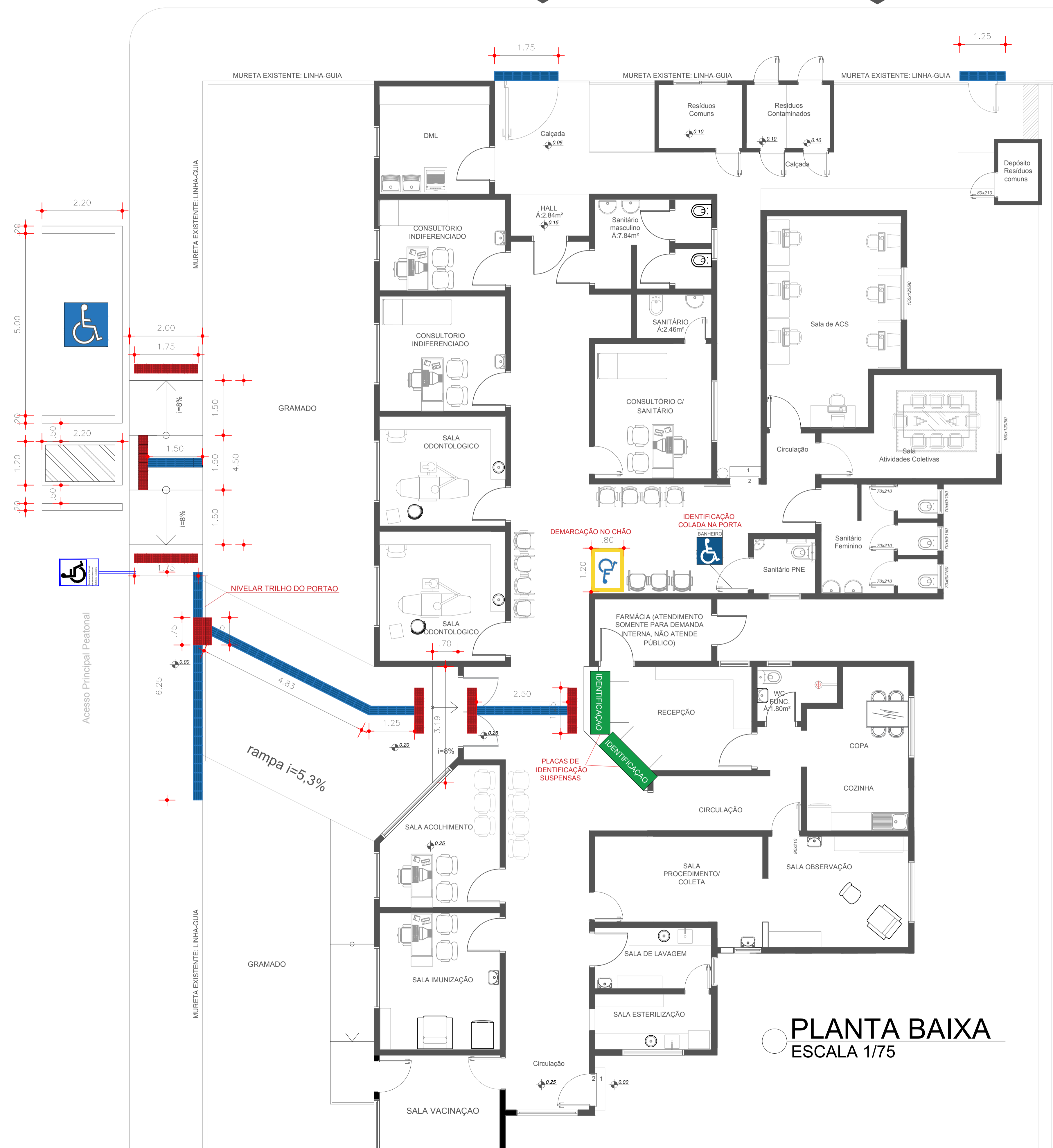
PLANTA BAIXA ESCALA 1/75