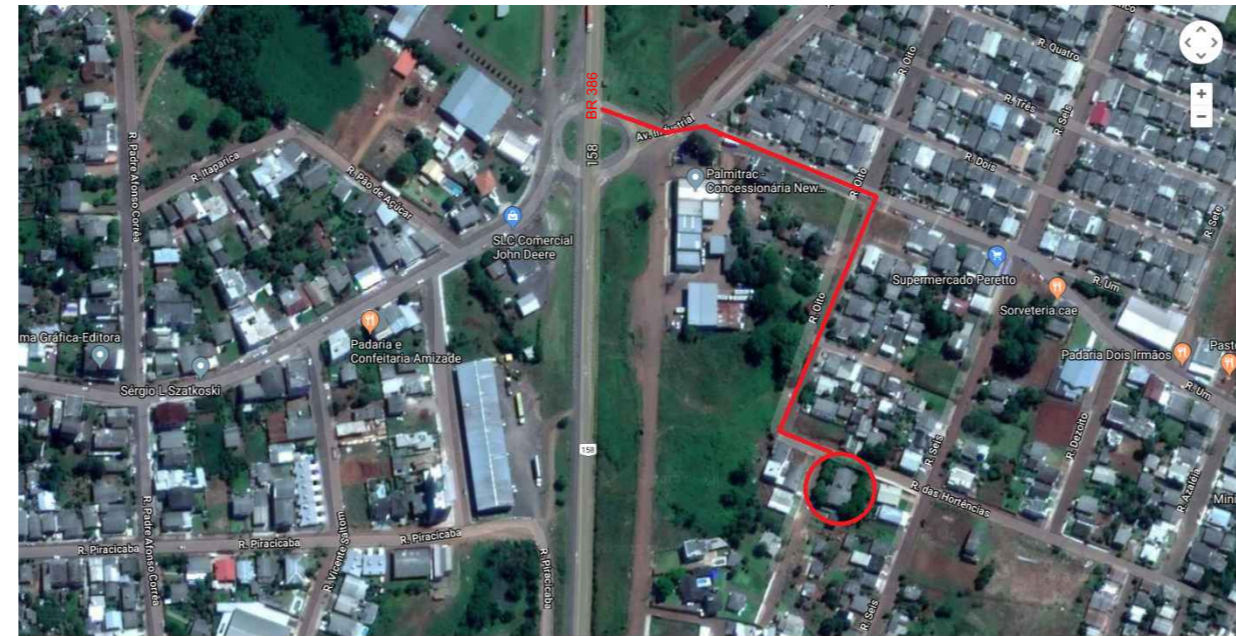
LOCALIZAÇÃO ESCALA: SEM ESCALA