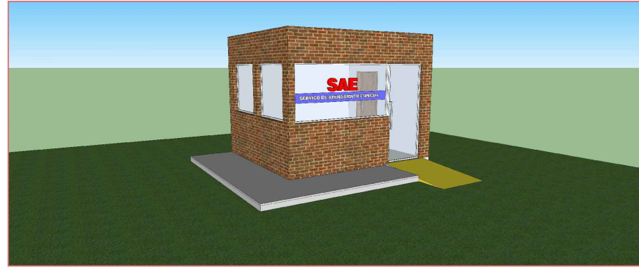
Desenho Ilustrativo da Fachada