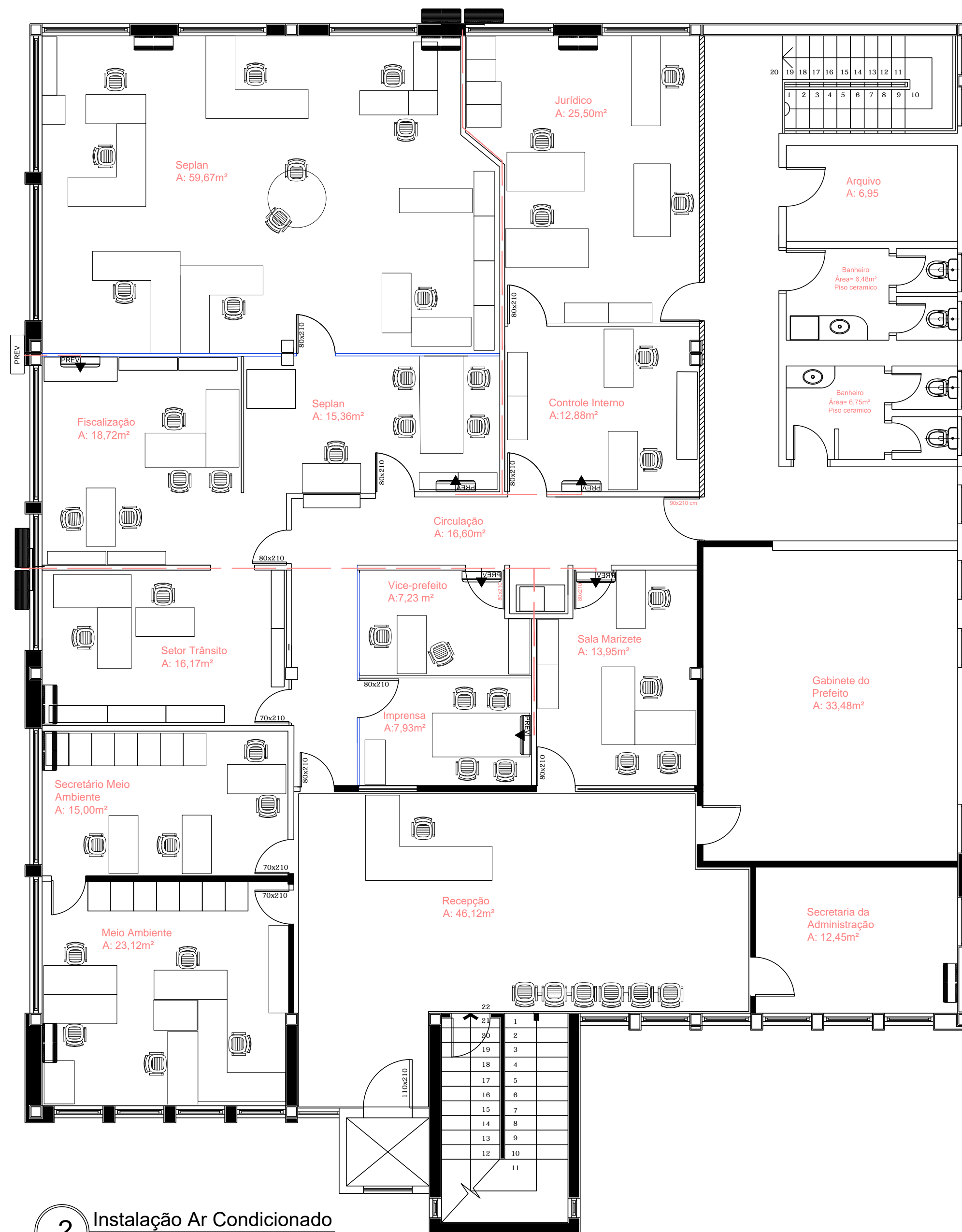
2 Instalação Ar Condicionado Escala: 1/75