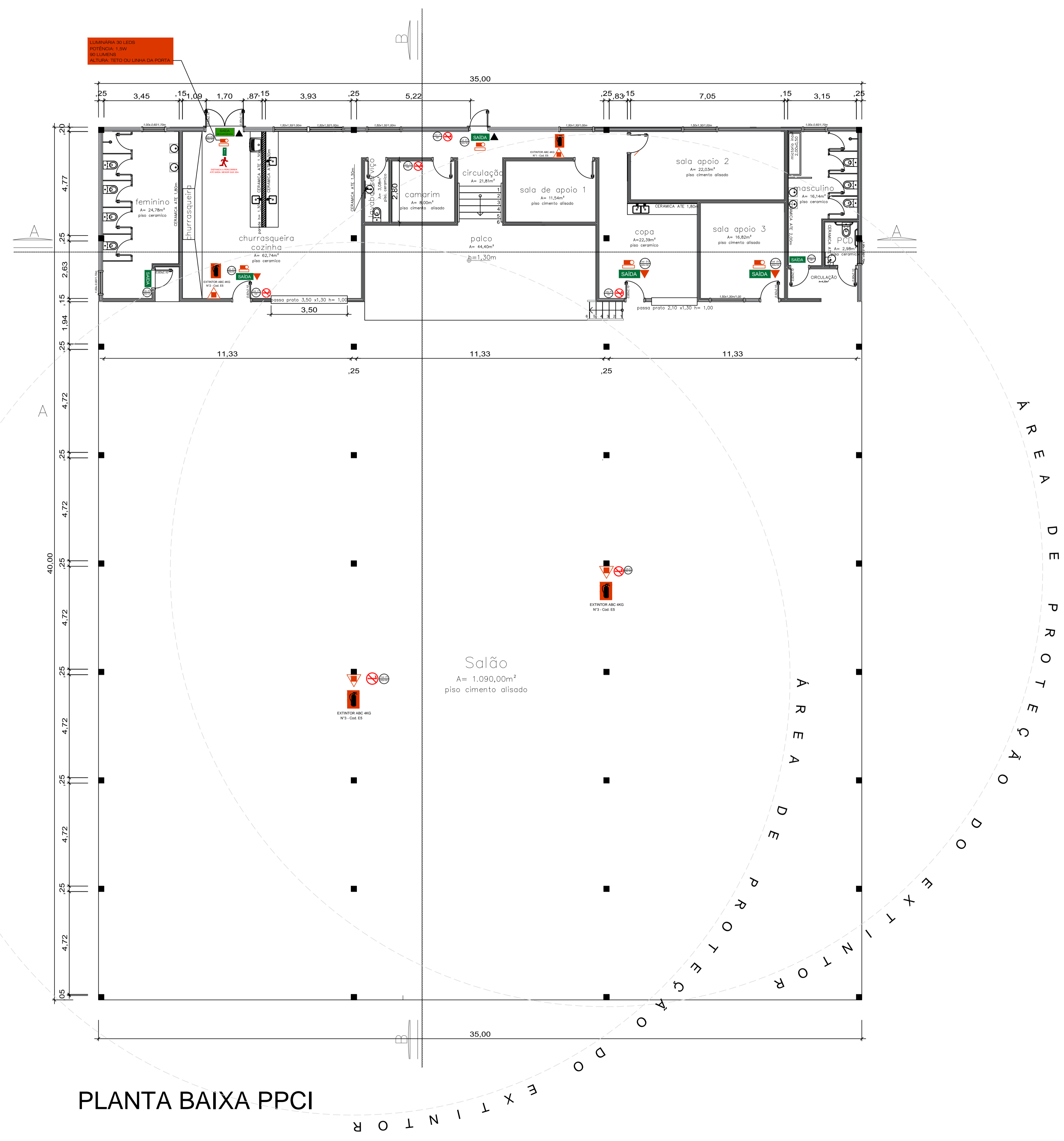
PLANTA BAIXA PPCI