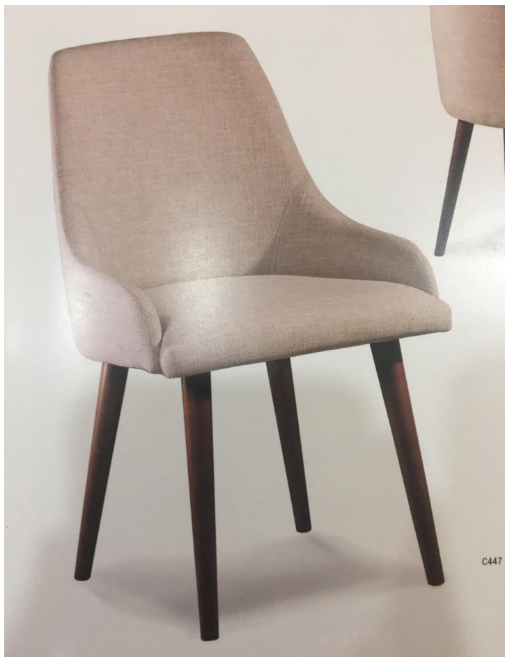
Item 07 , do Anexo I :