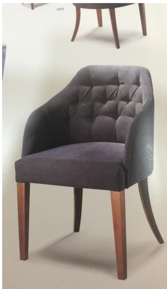
Item 08 , do Anexo I: