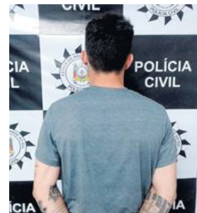
Homem preso acusado de participação em um roubo contra um motociclista

A Delegacia de Polícia Civil de Frederico Westphalen cumpriu na manhã de quinta-feira, 27, um mandado de busca e apreensão e um mandado de prisão temporária no município. A ação visa combater os crimes patrimoniais ocorridos em FW e faz parte da Operação Midas, que foi desencadeada em nível nacional.