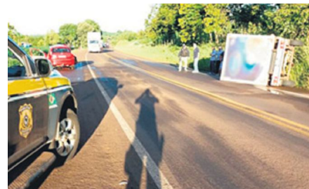
Acidente entre um carro e um caminhão de pequeno porte aconteceu na BR-386

De acordo com a Polícia Rodoviária Federal (PRF), posto de Seberí, o Fiesta trafegava no sentido Boa Vista das Missões-Lajeado Bugre e a Master no sentido contrário. As causas que ocasionaram o colisão seguem sendo investigadas. Os feridos, condutor do Master e os ocupantes do Fiesta – uma mulher identificada pelas iniciais D.M. e seu filho –, foram encaminhados para o Hospital de Caridade de Palmeira das Missões. A condutora do Fiesta ficou gravemente ferida e teve que ser transferida para o Hospital São Vicente de Paulo, de Passo Fundo, enquanto os demais envolvidos passam bem. Inclusive, conforme a casa de saúde de Palmeira das Missões, a criança recebeu