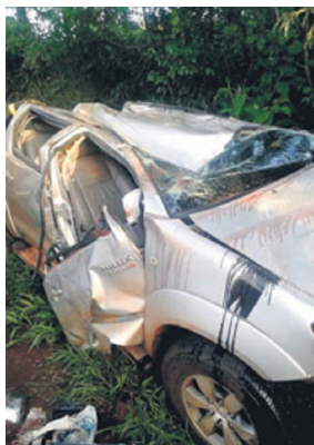
As pessoas feridas no acidente ocupavam a camionete

Um homem de 26 anos teve lesões leves, outro homem de 24 anos e o terceiro de 33 anos tiveram ferimentos de maior gravidade. Porém, detalhes de como ocorreu o capotamento e o estado de saúde dos envolvidos não foram divulgados pelas polícias e pela equipe do hospital. Além da PRF, atenderam ainda a ocorrência o Corpo de Bombeiros de Palmeira das Missões e a Brigada Militar.