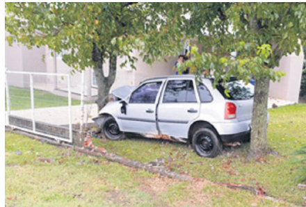
Carro saiu da pista, atingiu parte da cerca da residência e parou após colidir em uma árvore

– Nós já solicitamos para lideranças do município que seja instalado um quebra-molas um pouco acima da nossa casa, porque já aconteceram vários acidentes deste tipo aqui. É sempre um perigo, por-