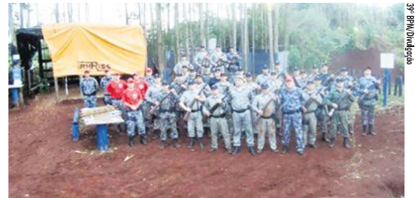
O 39º BPM busca implantar patrulhas tático móveis em Palmeira das Missões