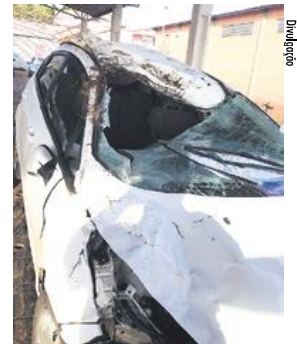
Carro de Santa Rosa ficou destruído após o atropelamento

nas ferimentos leves, mas o Ford Fiesta, placas de Santa Rosa, ficou completamente destruído. Há cerca de um ano, um acidente muito semelhante também aconteceu em Boa Vista das Missões, envolvendo um cavalo e um automóvel. De acordo com a lei, nesses casos, onde o animal é particular, o dono deve ressarcir o dano causado. Na colisão desta semana, o proprietário não foi identificado.