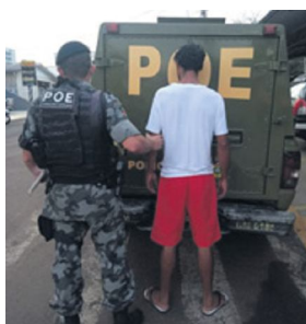
Indivíduo foi detido pelo POE, no dia 25

Um homem que possuía em seu desfavor um mandado de prisão em aberto foi detido em Frederico Westphalen. O indivíduo foi preso pelo Pelotão de Operações Especiais (POE), na quarta-feira, 25, no município frederiquense. Ele foi condenado por crime enquadrado na Lei Maria da Penha. Após abordado, o homem foi conduzido à Delegacia de Polícia e, posteriormente, ao presídio frederiquense.