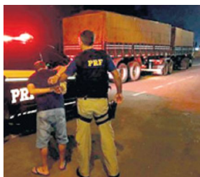
Motorista da carreta detido pela PRF, em Lajeado. Homem disse que pegou o veículo em Iraí

Conforme a PRF, o homem, natural de Uruguaiana, relatou aos policiais que receberia R$ 10 mil pelo transporte da droga até a região Metropolitana. Ainda de acordo com o relato do condutor,