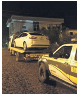
Carro foi recuperado no interior de Rodeio Bonito pela BM

De acordo com a BM, o carro possuía placas de Joinville (SC). No entanto, tratava-se de uma identificação falsa, de um clone. Originalmente, o carro estava emplacado em Santa Maria. O veículo possuía registro de furto ocorrido em Porto Alegre, neste mês. A ocorrência foi encaminhada à Delegacia de Polícia Civil rodeiense.