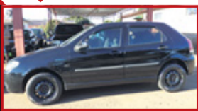
Palio Celebration 1.0 2007 completo