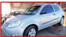
Ka 1.0 2011