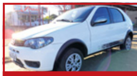
Palio Fire 2015 completo