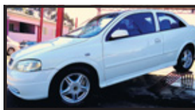
Astra 1.8 GL 2001 completo