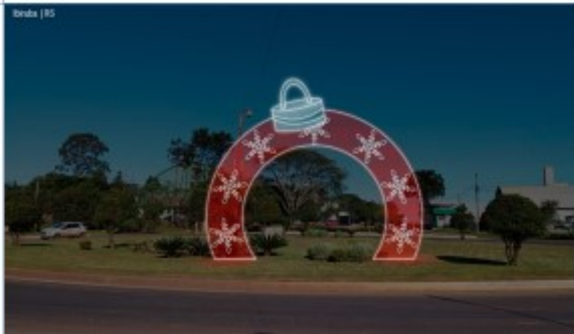
CANTEIRO TREVO PRINCIPAL