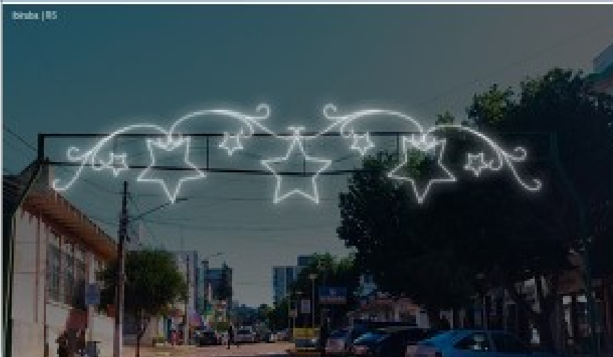
RUA GENERAL OSÓRIO