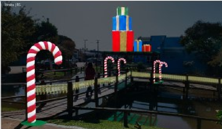
PRAÇA MARIA GORETI