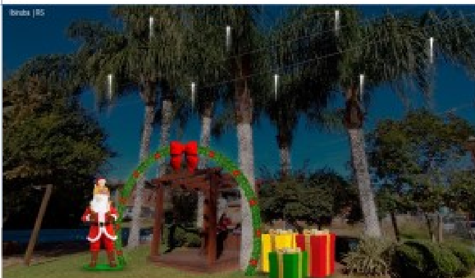
PRAÇA MARIA GORETI