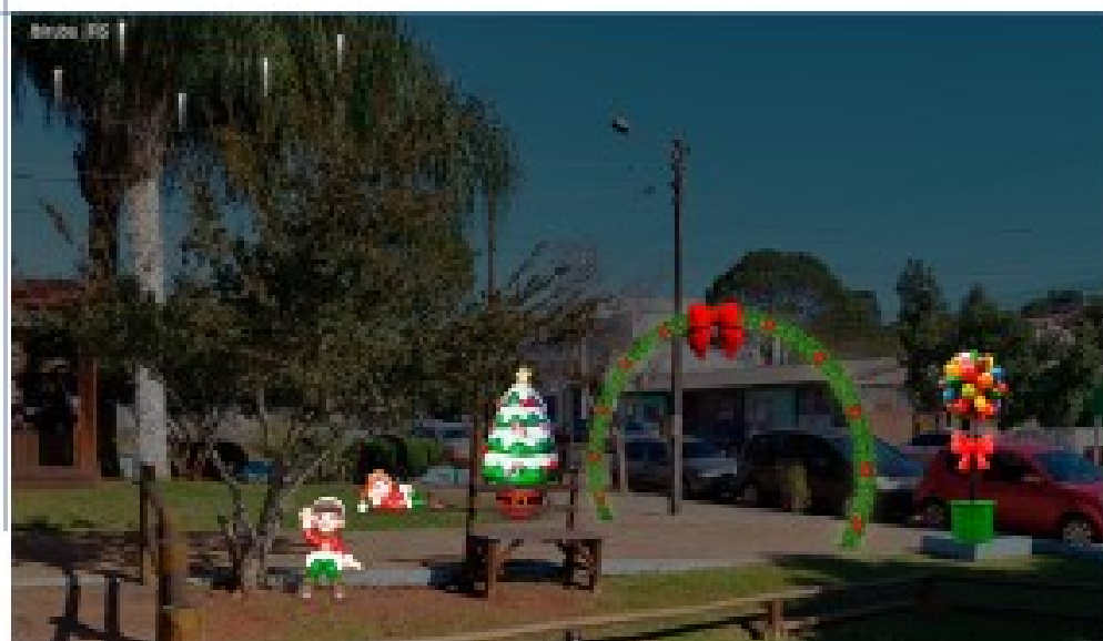
PRAÇA MARIA GORETI