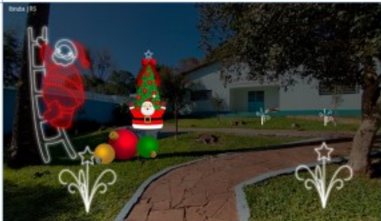
PRAÇA MARIA GORETI