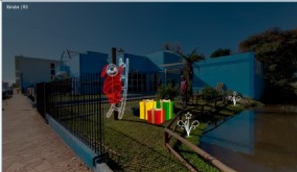
PRAÇA MARIA GORETI