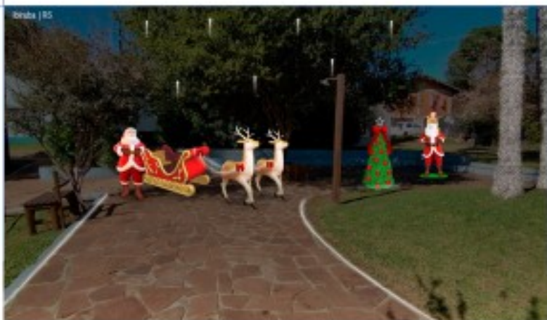
PRAÇA MARIA GORETI