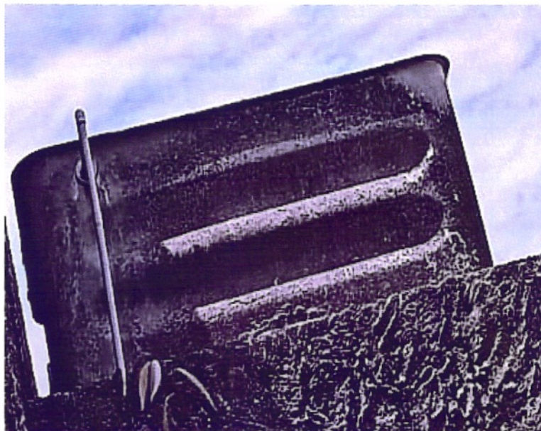
Imagem 4: Atual Caixa d'água do CTG

d'água. Até então, esse era o único tipo da fibra, "reconhecidamente cancerígena", que podia ser comercializada no Brasil.