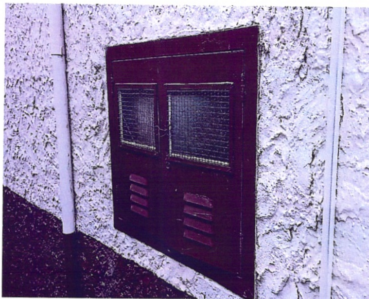
Imagem 1: Padrão de entrada de Energia do CTG

A situação da atual entrada de energia elétrica é crítica, como pode-se observar nas imagens 1, 2 e 3. Da forma que se encontra o padrão de entrada de energia elétrica pode ocasionar penalidades da fornecedora de energia elétrica com a entidade e até mesmo a queima de equipamentos e eletrodomésticos.