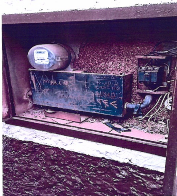
Imagem 2: Padrão de entrada atual do CTG

"REACENDER O BRIO DA RAÇA NO FOGO DA TRADIÇÃO"