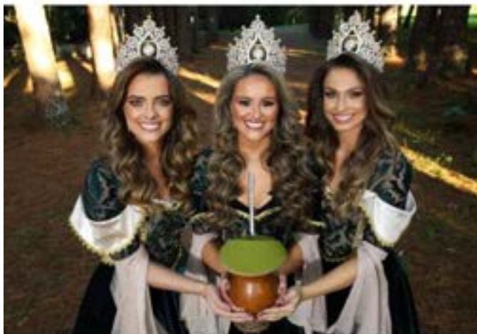
Trajes Sociais 16º Fenachim

Os trajes sociais são elementos importantes da corte e da festa além de carregar luxo ela agrega beleza herança cultural e história. O vestuário e a moda são temas que refletem na nossa linguagem estética e com os períodos marcantes que formam essa nossa herança cultural. Sendo assim, os trajes seguem com um mix de referências traduzidas em um traje exclusivo marcante e luxuoso dentro do que segue a tradição, com inspirações e pequenos detalhes que permeiam nas vestimentas da era imperial bem como a essência do chimarrão presente nos bordados, nos tecidos nobres e no sentimento presente em cada detalhe dos trajes.