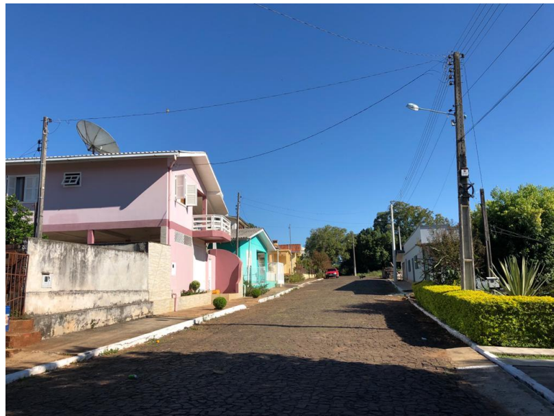
Imagem 05: Visualização da rede elétrica, bem como trechos onde serão executados os novos passeios e meio-fio.