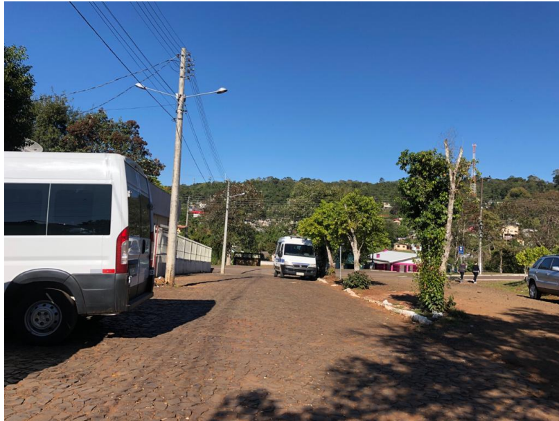
Imagem 06: Trecho final do logradouro, nas proximidades da Unidade Básica de Saúde.

Iraí. O Paraíso das Águas Termais. DEPARTAMENTO DE ENGENHARIA