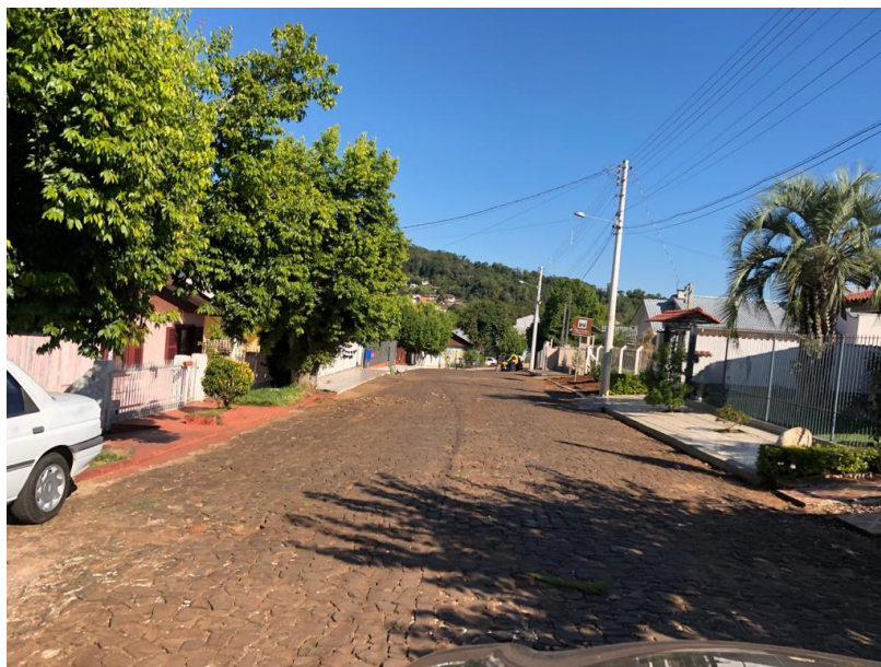
Imagem 03: Trecho a ser pavimentado, demonstrando a existência das redes de energia elétrica, iluminação pública e telefonia. Neste trecho serão efetuadas a instalação de bocas de lobo e galerias pluviais.