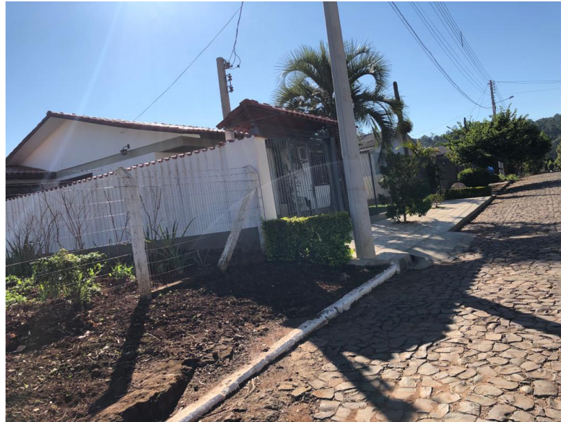
Imagem 04: Trecho que será contemplado com novo meio-fio e passeio.

Iraí. O Paraíso das Águas Termais. DEPARTAMENTO DE ENGENHARIA