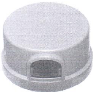
Relé fotoelétrico eletromagnético

Relé fotoeletromagnético com célula Fotoelétrica: Tipo Cds com encapsulamento blindado de resposta instantânea, montado na posição lateral, frequência / corrente: 50/60Hz; corrente máxima de 10 A, potência: 1000 W (Carga Resistiva) - 1200 VA 127V; 1800VA 220V (Carga Indutiva), faixa de operação: 5 a 20 lux para ligar e no máximo 40 lux para desligar Relação desligar/liga mínima 1,2. De acordo com ABNT NBR 5123/2016; Sobre consulta a faixa de operação pode ser fornecida conforme especificação do cliente, temperatura de trabalho: -5°C a + 50°C, consumo: 0,8 W e proteção contra surtos.