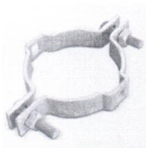
Cinta de aço galvanizado