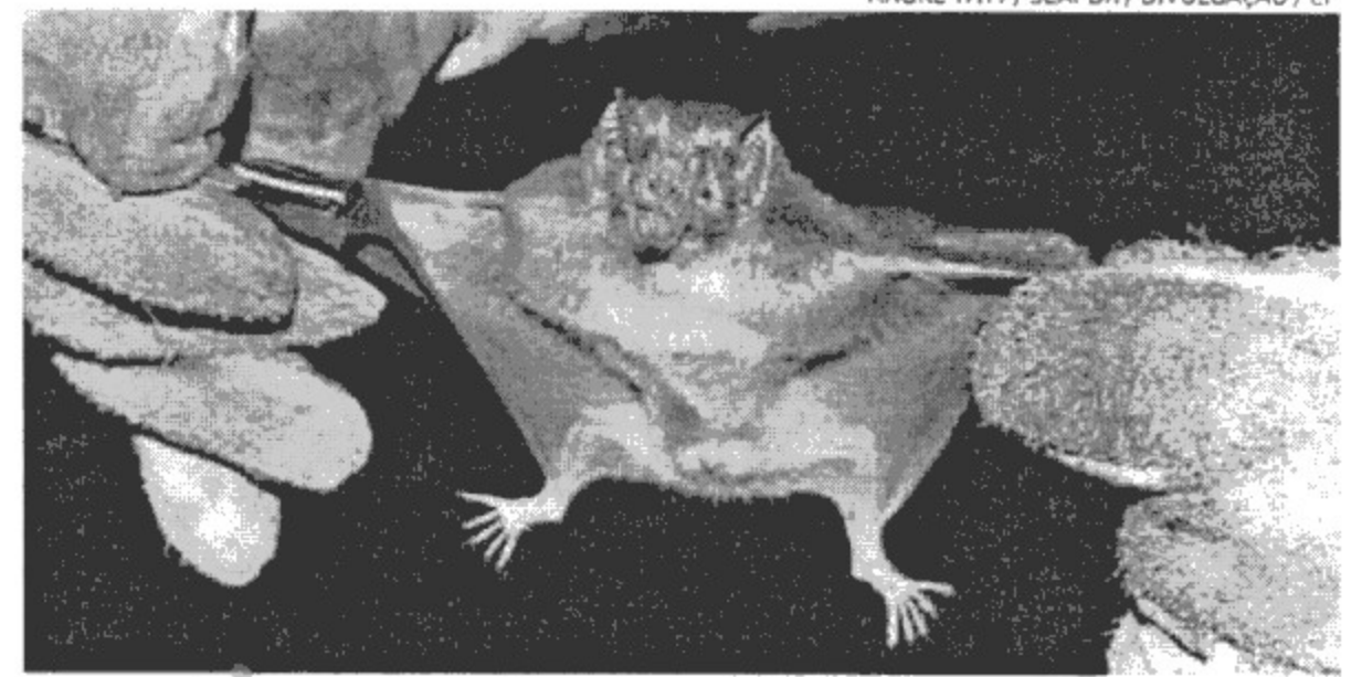
Presença de morcego hematófago deve ser comunicada à Defesa Agropecuária