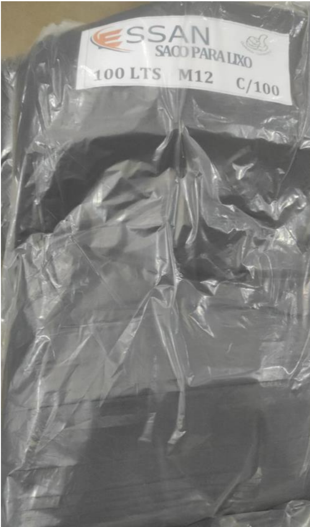
49 - SACO DE LIXO 50 LITROS, FUNDO REFORÇADO