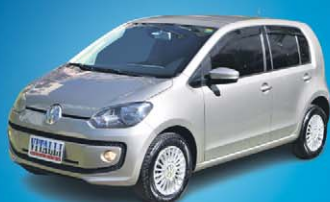
UP MOVE I-MOTION 1.0 FLEX 2016