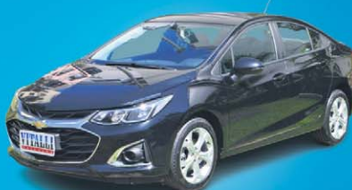
CRUZE LT 1.4 TURBO FLEX AUT. 2022