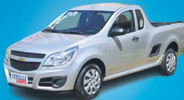
MONTANA LS 1.4 8V FLEX 2020