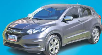
HR-V LX 1.8 FLEX CVT 2018