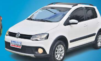
CROSSFOX 1.6 8V FLEX 2014