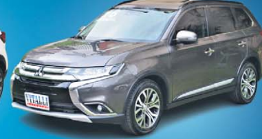
OUTLANDER 2.2 4X4 TB DIESEL AUT. 7L 2016