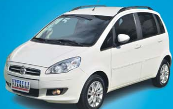
IDEA ATTRACTIVE 1.4 FIRE FLEX 2015