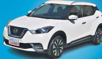
KICKS SL 1.6 FLEX CVT 2020