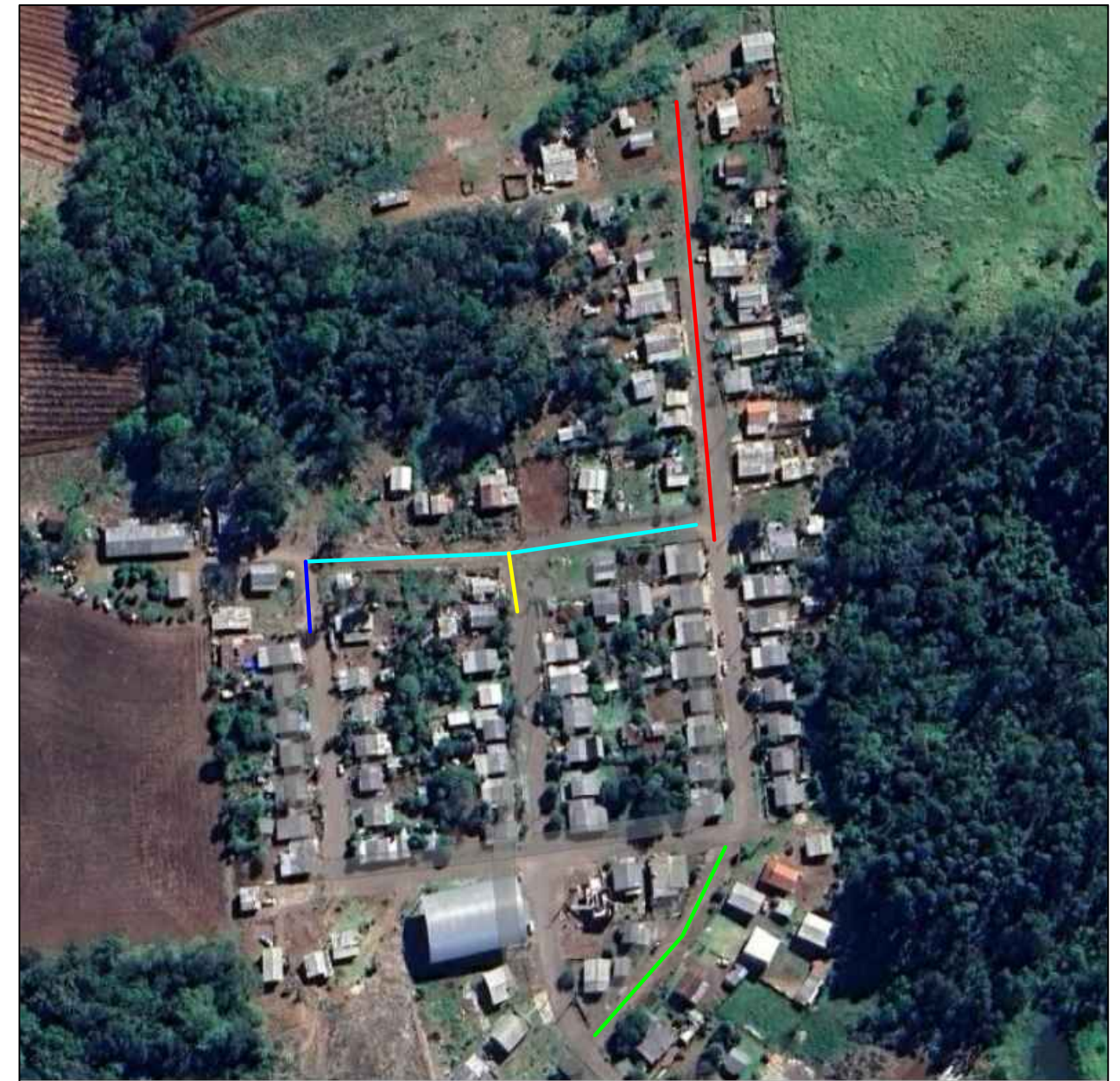
01 Localização s/ escala