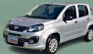
UNO ATTRACTIVE 1.0 FIRE FLEX 2021