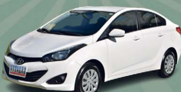
HB20S COMFORT PLUS 1.6 FLEX 2015