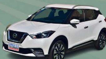
KICKS SL 1.6 FLEX CVT 2020