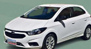
ONIX JOY BLACK EDITION 1.0 FLEX 2021