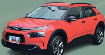
C4 CACTUS FEEL 1.6 FLEX AUT. 2022