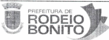
MUNICIPIO DE RODEIO BONITO PAULO DUARTE CONTRATANTE

Rodeio Bonito - RS, 13 de dezembro de 2024.