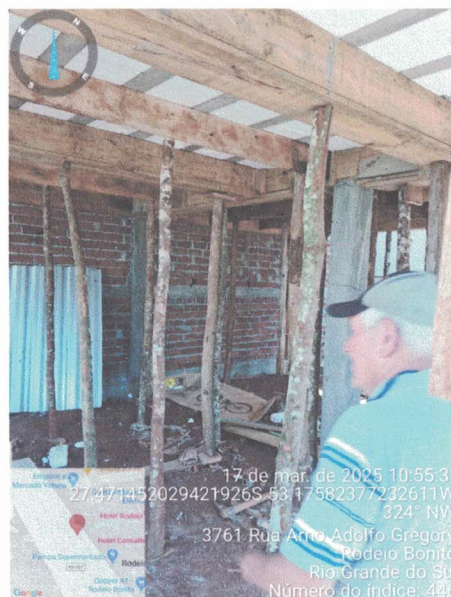
Figura 3 - Vista interna da obra