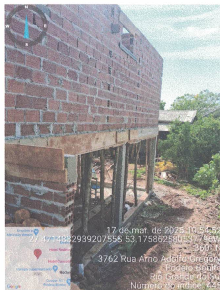
Figura 2 - Estrutura executada