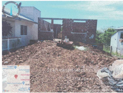
Figura 1 - Fachada frontal da obra