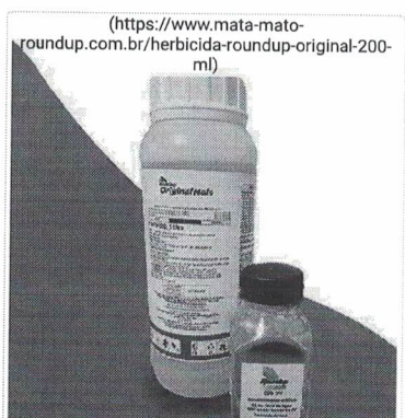
Herbicida Roundup Original 200 ml - Glifosato 48% Veneno Mata Mato ( https://www.mata-mato-... )