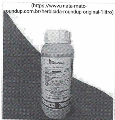
Herbicida Roundup Original 1 Litro - Glifosato 48% Veneno Mata Mato ( https://www.mata-mato-... )