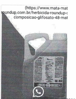
Herbicida Roundup Origin - Composição Glifosato 4 Mato ( https://www.mat )

( https://www.mata-mato-roundup.com.br ) text=Em que posso ajuda produto está interessad