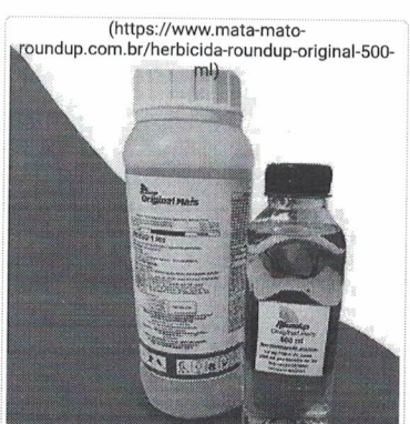
Herbicida Roundup Original 500 ml - Glifosato 48% Veneno Mata Mato ( https://www.mata-mato-... )