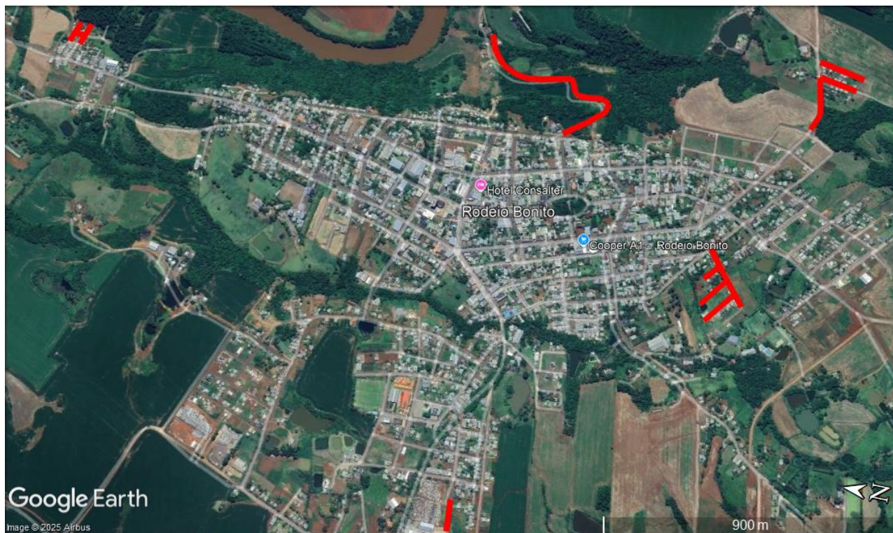
Figura 1 - Ruas de Intervenção na Cidade