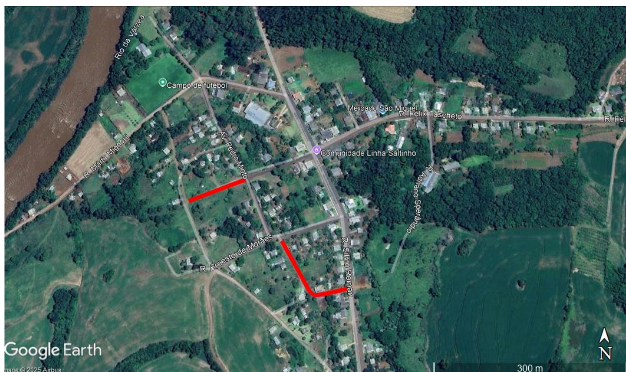
Figura 2 - Intervenções no Distrito de Saltilho