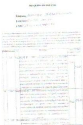
orçamento rodeio 01.jpeg ~532 KB