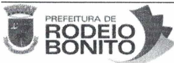
Secretária de Educação, Cultura e Desportos Lurdes Ciprandi