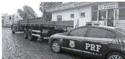
Caminhão clonado tinha sinais de identificação pertencentes a um veículo do Exército

O veículo de carga, um Ford/Cargo 2629, com placas de São Paulo (SP), era clonado. De acordo com a PRF, os sinais de identificação, como o número do chassi, pertencem a um veículo do Exército, ainda não identificado até o fechamento desta edição, na manhã de ontem, 5. Diante do fato, o con-