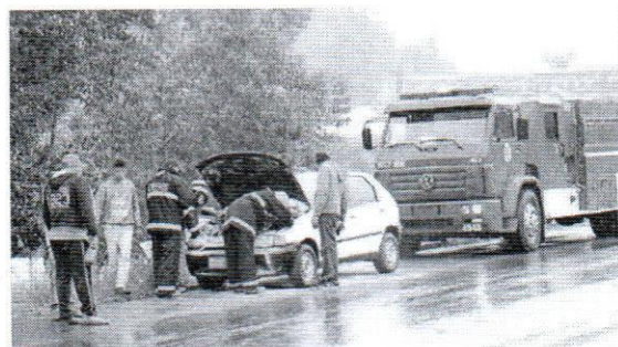
Carro trafegava pela BR-386 quando fogo iniciou no motor do automóvel

Um princípio de incêndio atingiu um Fiat/Palio, com placas de Frederico Westphalen, por volta das 12h40min de segunda-feira, 4. O automóvel trafegava na altura do trevo de acesso a FW, na BR-386, quando o fogo iniciou no motor do veículo. O motorista