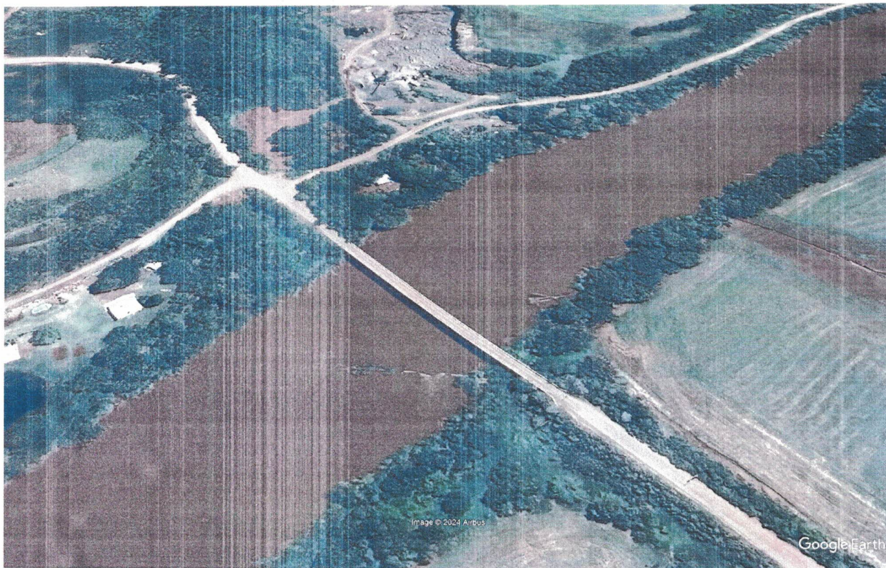
VISTA DA PONTE: ANTERIOR A QUEDA