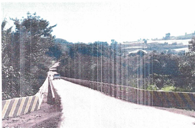
VISTA DA PONTE: ANTES DA QUEDA

A solução proposta com a contratação dos serviços acima descritos se baseia na necessidade de reconstrução da ponte sobre o Rio da Várzea, cujo colapsou na enchente do dia 02 de maio de 2024.