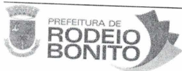
Paulo Duarte Prefeito Municipal

Av. do Comercio, 196 | CEP: 98360-000 Fone: 55 3798 1155 | fax: 55 3798 1184 E-mail: administracao@rodeio bonito.rs.gov.br CNPJ: 87.613.204/0001-86