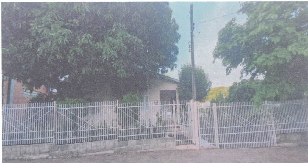
Figura 3 - FRENTE IMÓVEL