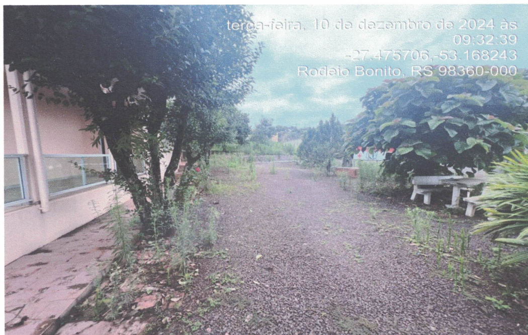
Figura 4 - PARTE INTERNA DO LOTE