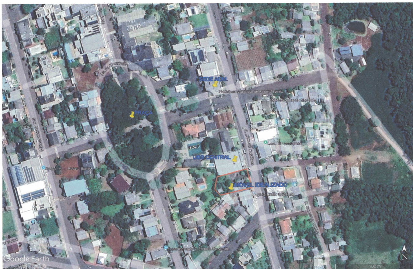
Figura 2 - LOCALIZAÇÃO IMÓVEL COORDENADAS: -27.47592°; -53.168365°