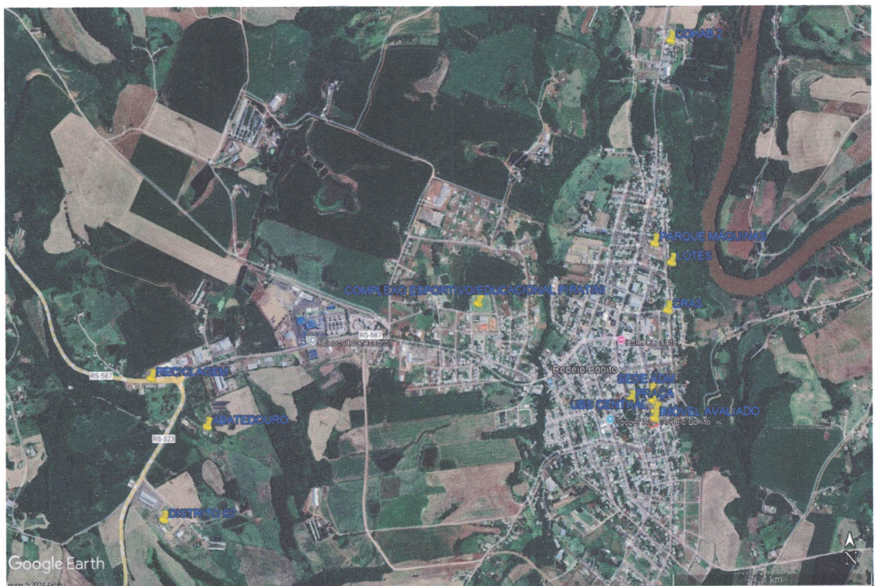
Figura 1 - localização imóveis urbanos

O município de Rodeio bonito, possui diversos imóveis, mas em sua maioria já com benfeitorias existentes e já utilizados para outras necessidades, os locais aonde há imóveis sem benfeitorias, são lugares de difícil acesso e que comprometem a destinação do espaço para uma nova Unidade Básica de Saúde.