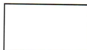
Polegar direito 2

Atesto que o(s) titular(es) acima identificado(s) atende(m) aos critérios definidos no Manual de Crédito Rural para enquadramento como beneficiário(a)(s) do Crédito Rural ao amparo do Pronaf no Grupo V. Grupo Final: V