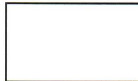
Polegar direito 1