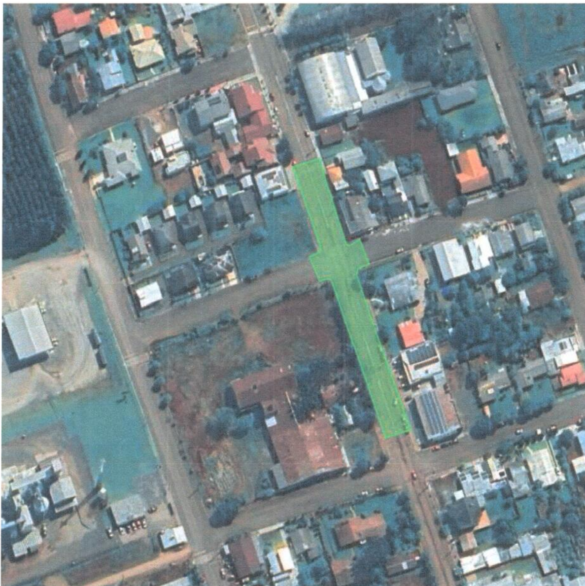
Figura 01: Localização do trecho contemplado com o recalpeamento

HERGYA APARECIDA KELLER Engenheira Civil – CREA-RS 219763