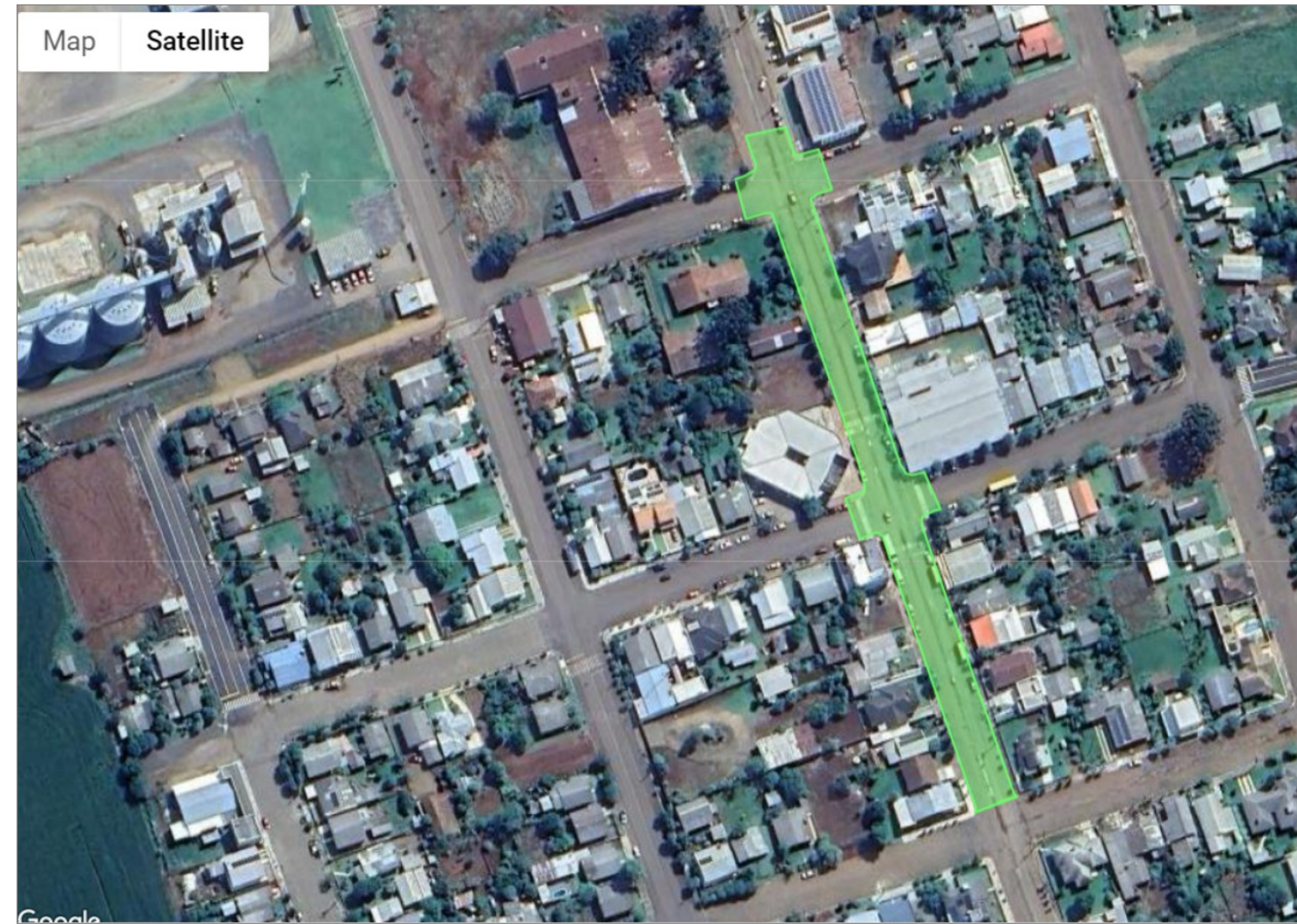
—ENG SITUAÇÃO/ LOCALIZAÇÃO DAS RUAS – GOOGLE EARTH SEM ESCALA