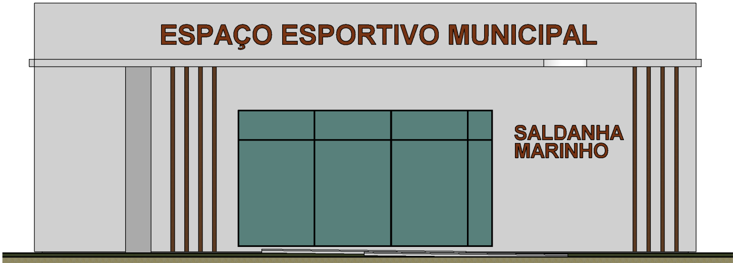
1 fachada Frontal ESCALA 1 : 75