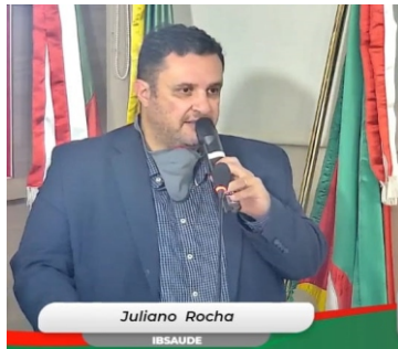
Indicações, Requerimentos e Anteprojeto de Lei