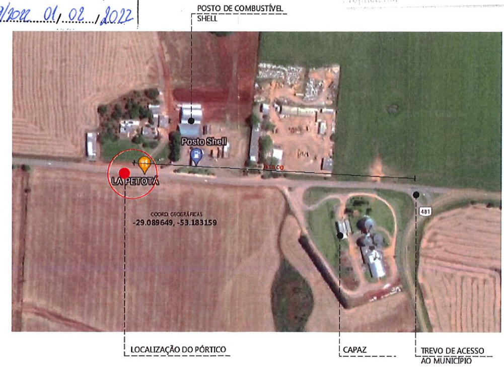
2 SITUAÇÃO/LOCALIZAÇÃO ESC.: 1/5000

As cotas de planta de Situação e Localização são de responsabilidade do Responsável Técnico e do Proprietário.