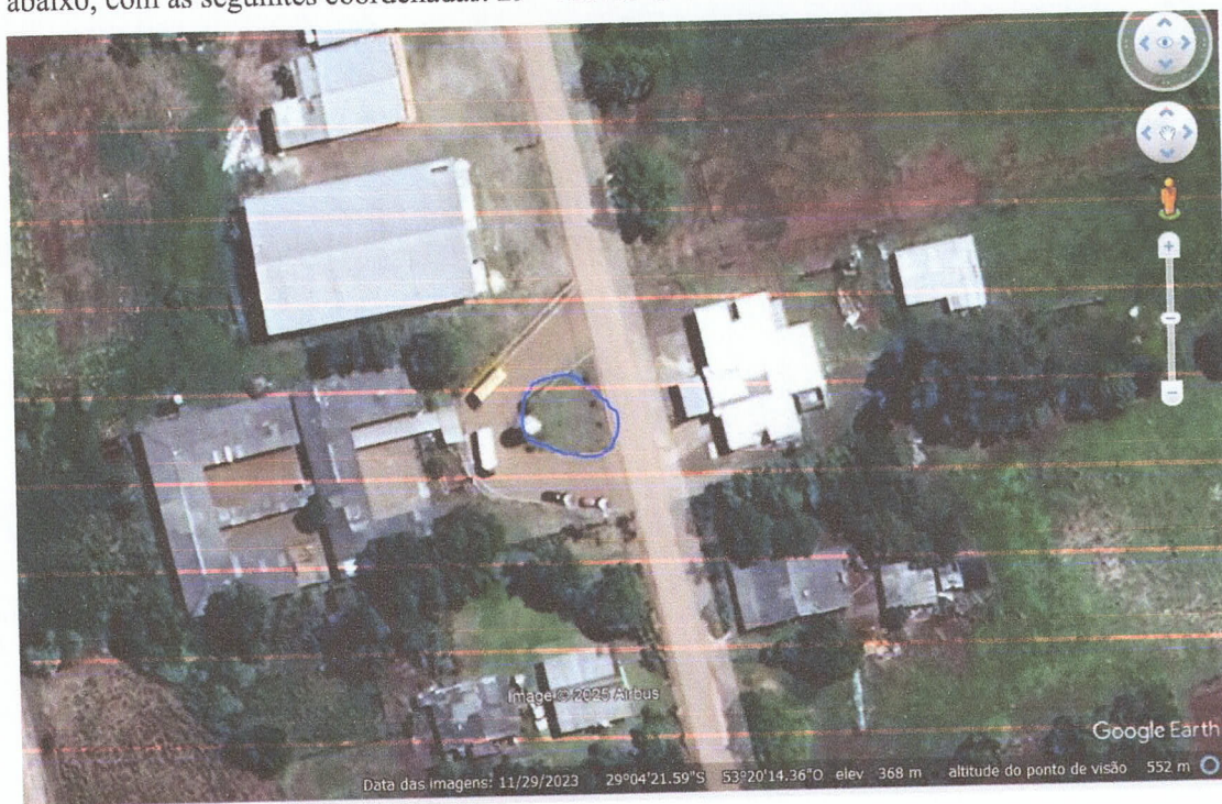
Figura 1 - Identificação do ponto para perfuração.

Após a identificação dos lineamentos estruturais da região, foi realizado um levantamento das características do local para a definição do ponto ideal para perfuração. Foi levado em consideração, a existência de rede elétrica nas proximidades, a possibilidade de acesso dos equipamentos para perfuração e construção do poço e a possibilidade de conexão do poço na rede de abastecimento existente, desta forma foi escolhido o ponto em azul, demarcado na figura abaixo, com as seguintes coordenadas. 29° 4'23.63"S 53°20'11.10"O