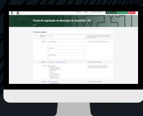
CARAZINHO / RS www.carazinho.cespro.com.br