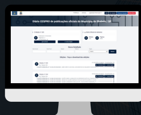
ILHABELA / SP www.ilhabela.cespro.com.br