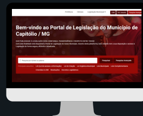
CAPITÓLIO / MG www.capitolio.cespro.com.br