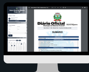
RIBEIRÃO PRETO / SP www.diarioribeiraopreto.cespro.com.br