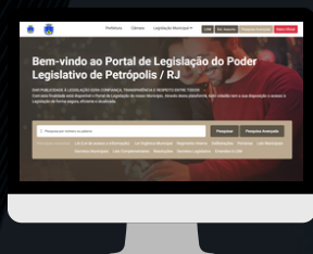
PETRÓPOLIS / RJ www.petropolis.cespro.com.br