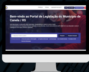
CANELA / RS www.canela.cespro.com.br